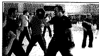
"אני נזרם חרונה נפלאה לחבריה". נעים מאמן

לדבריו נעים, לאחר שמיצה את תחום הקראטה עבר ללמוד אייקודו - סוג של אמנות לחימה שהיא דרך חיים ופילוסופיה חברתית שוחרת שלום. מטרתו של האייקודוקו (מי שמתרגל איי